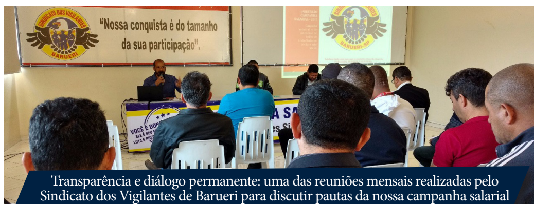
Transparência e diálogo permanente: uma das reuniões mensais realizadas pelo Sindicato dos Vigilantes de Barueri para discutir pautas da nossa campanha salarial

O Sindicato é um mero coadjuvante na negociação coletiva. A diretoria do Sindicato nada mais é do que interlocutora entre o trabalhador e o empregador. Como